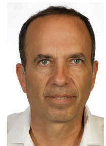
מאת: אברהם טננבוים*

הספר שלפנינו שואל האם יש לערכים יהודיים הלכתיים מקום בשיטת המשפט הישראלי? ועוסק בעיקר בתשובה ומרכיביה.